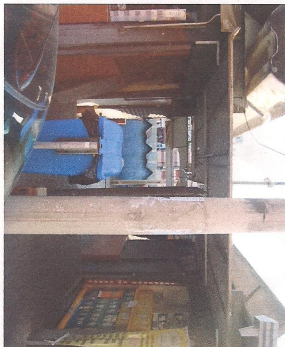
Espaço entre os box 37 e 36