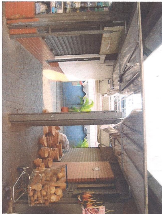
Espaço entre os box 41 e 42